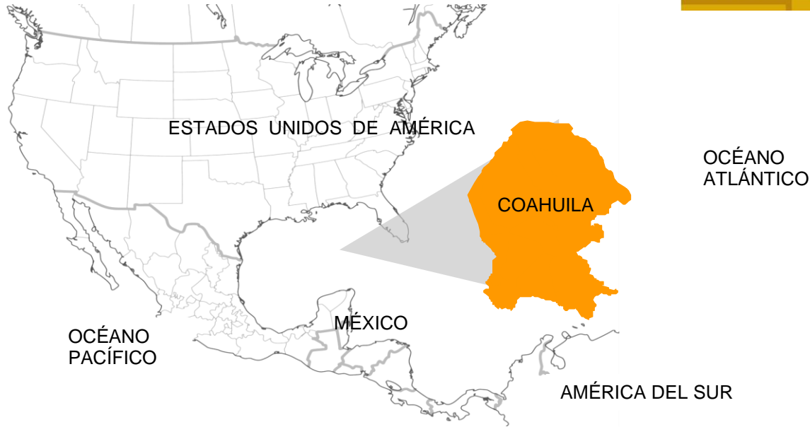
Ubicación de Coahuila de Zaragoza en Norteamérica.